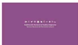
1. SUBPO B