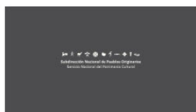
1. SUBPO A