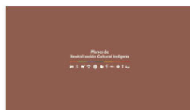
2. PLANES A