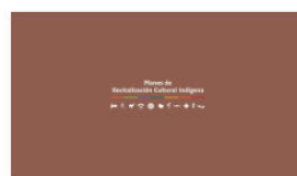
2. PLANES A