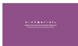
1. SUBPO B