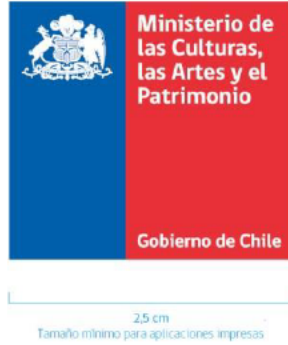
Logo con escudo sin sintetizar

SUBPO tiene 2 identidades gráficas. Las identidades de los “Planes de Revitalización Cultural Indígena y/o Planes de Revitalización Cultural Indígena y Afrodescendiente” y “Derechos Culturales Indígenas y Afrochilenos” las que deberán ser incorporadas en el material de difusión, a modo de imagen dentro del contexto de la difusión y no como logotipo .