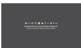
1. SUBPO A