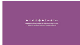
1. SUBPO B