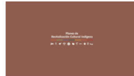
2. PLANES A