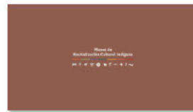
2. PLANES A