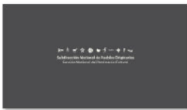
1. SUBPO A