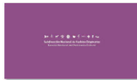
1. SUBPO B