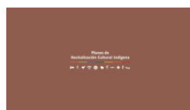
2. PLANES A