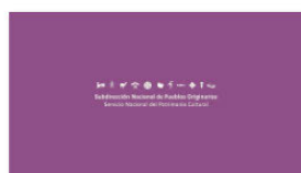
1. SUBPO B