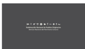
1. SUBPO A