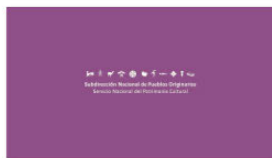
1. SUBPO B