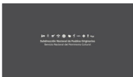
1. SUBPO A