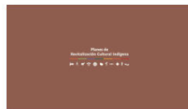
2. PLANES A