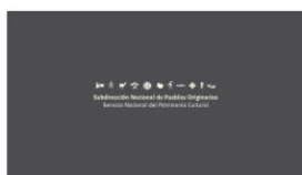
1. SUBPO A