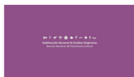
1. SUBPO B