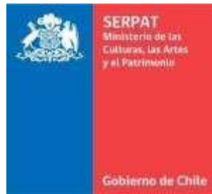
Logotipo Serpat con escudo sintetizado (uso en pieza digital)