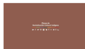
2. PLANES A