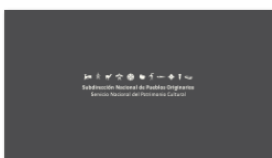
1. SUBPO A