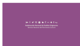
1. SUBPO B