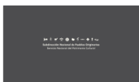
1. SUBPO A