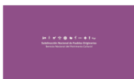
1. SUBPO B