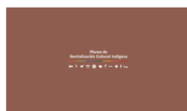
2. PLANES A