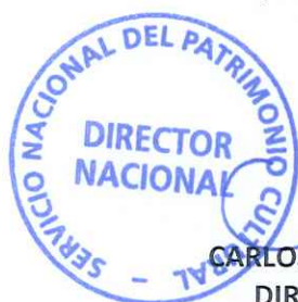
CARLOS MAILLET ARÁNGUIZ DIRECTOR NACIONAL SERVICIO NACIONAL DEL PATRIMONIO CULTURAL