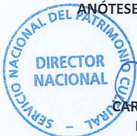
CARLOS MAILLET ARÁNGUIZ DIRECTOR NACIONAL

SERVICIO NACIONAL DEL PATRIMONIO CULTURAL