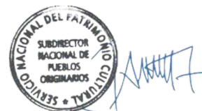
José Ancan Jara Subdirector Nacional de Pueblos Originarios