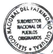
José Ancan Jara Subdirector Nacional de Pueblos Originarios