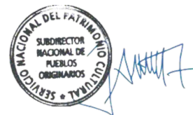
José Ancan Jara Subdirector Nacional de Pueblos Originarios