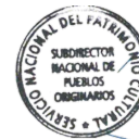
José Ancan Jara Subdirector Nacional de Pueblos Originarios