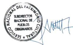
José Ancan Jara Subdirector Nacional de Pueblos Originarios