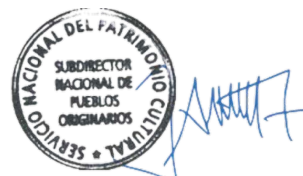
José Ancan Jara Subdirector Nacional de Pueblos Originarios