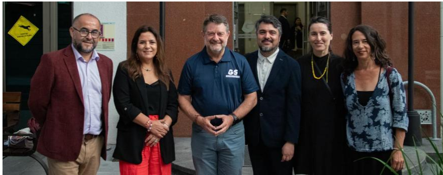
Exposición ante el pleno del GORE la solicitud de uso gratuito de Maticana 753