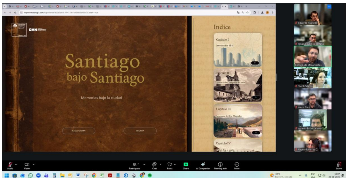
Imagen N°5: Revisión del Story map: Proyecto SBS.

Ruta: https://storymaps.arcgis.com/templates/cc3f1c04df1a47e59611b47fab9ba2b7/edit