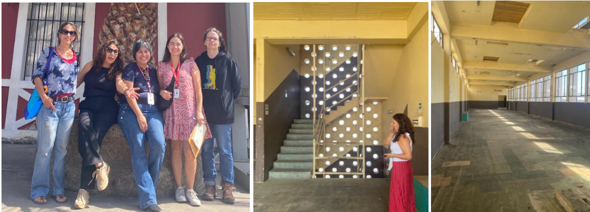
Imágenes de la visita al Museo Regional de Antofagasta y Ex Molinera