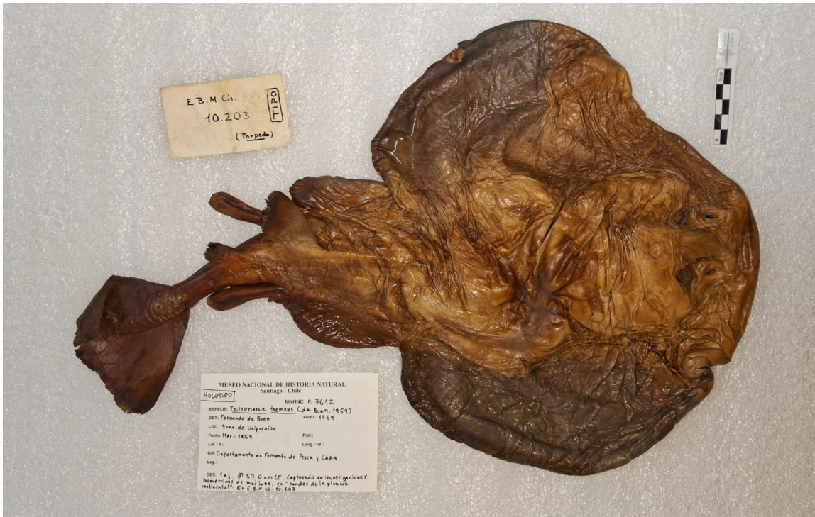
MNHNCL ICT-7612. Holotipo de Tetronarce tremens (de Buen, 1959)