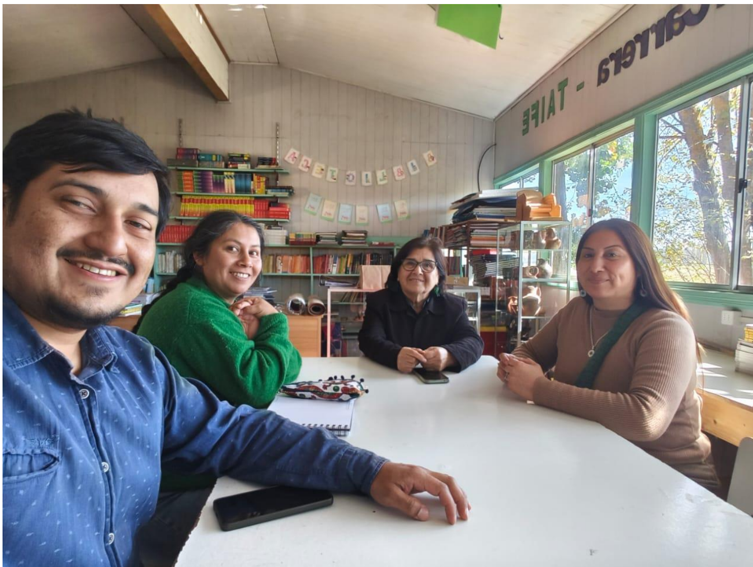
Reunión con directora escuela Carahue

Ministerio de las Culturas, las Artes y el Patrimonio