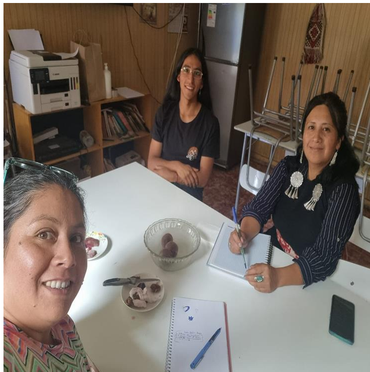
Reunion con escuela San Pedro Rapa.

Ministerio de las Culturas, las Artes y el Patrimonio