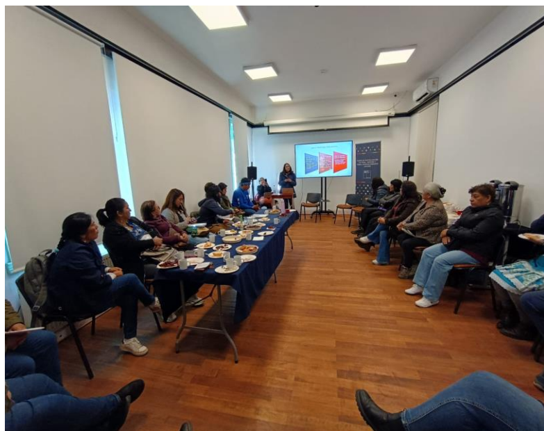
Dialogo de Priorización con representante de 16 comunidades mapuche