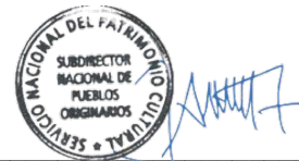
José Ancan Jara Subdirector Nacional de Pueblos Originarios y del Pueblo Tribal Afrodescendiente Chileno