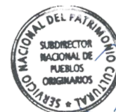
José Ancan Jara Subdirector Nacional de Pueblos Originarios