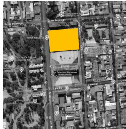
Imagen del Estudio de cabida Matucana N°573