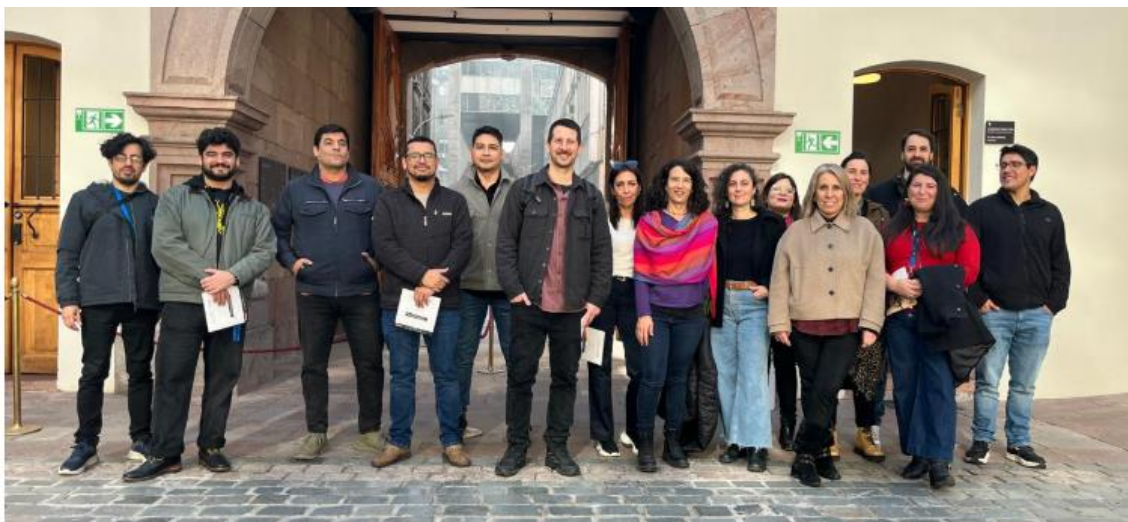
Imagen de la UPI en la visita al Museo de Santiago, Casa Colorada.