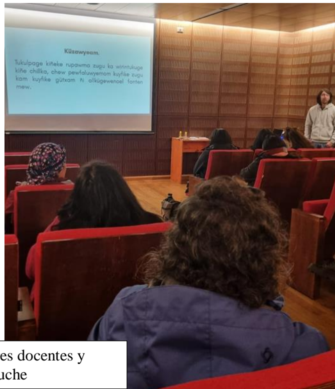
Formación de Formadores docentes y artistas educadores mapuche