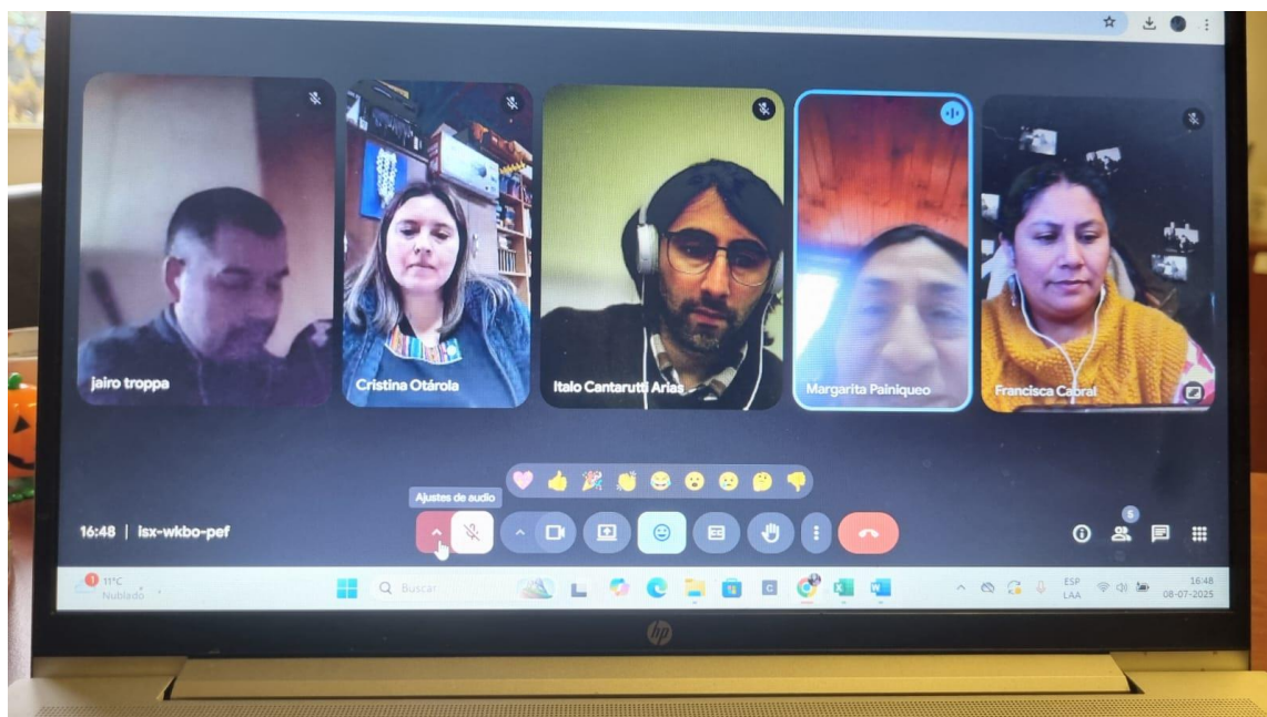
Reunión con escuela Rukayeko de Lumaco, coordinar ABP de la escuela con docente y artista educadora