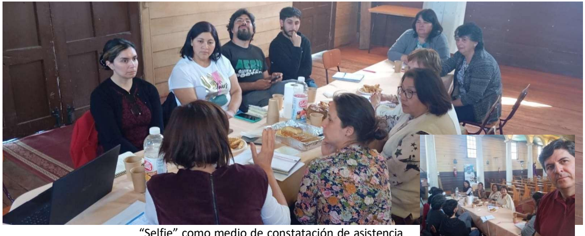
"Selfie" como medio de constatación de asistencia

NOMBRE Y FIRMA DEL FUNCIONARIO QUE REALIZA EL INFORME