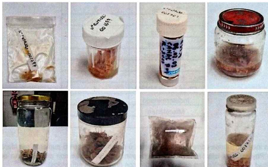
Figura 1: Ejemplo del estado de conservación de los lotes seleccionados para ser trabajados en esta quinta etapa.

Los lotes trabajados durante el período informado fueron seleccionados en su totalidad del material en tránsito (sector poniente AZI), por encontrarse en condiciones críticas de conservación debido al alto grado de evaporación del preservante o presentar contenedores averiados (Fig. 1).