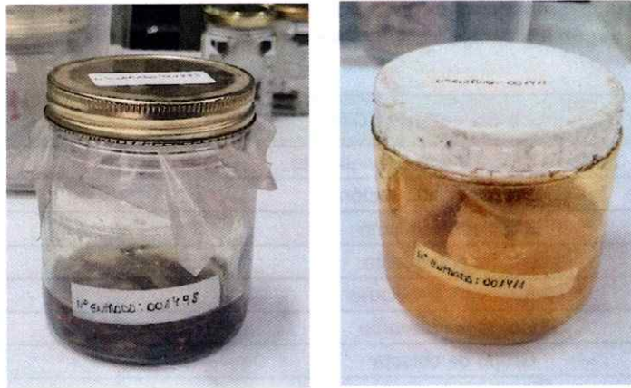
Figura 2. Lotes con N° de entrada asignado en etiqueta de papel de algodón al interior del frasco y en etiqueta adhesiva en la tapa