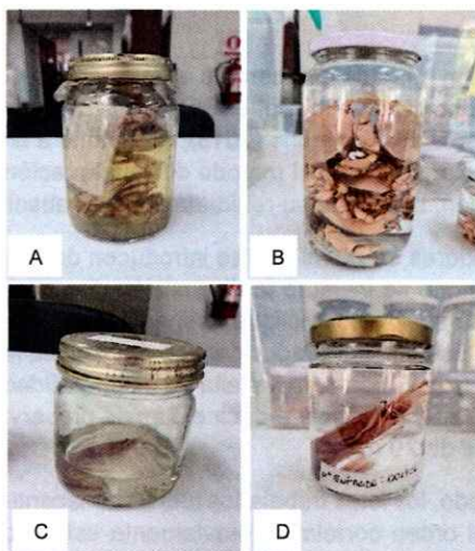
Figura 4. Estado de los lotes antes y después del manejo curatorial. A y C- Estado de un lote previo al manejo curatorial (se puede apreciar la evaporación del conservante). B y D- Estado posterior al manejo curatorial.

*Se entiende por "lote" a uno o más ejemplares asociados a un número de entrada o catálogo.