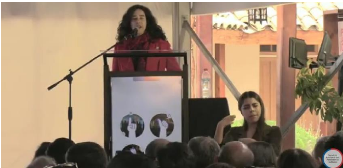
Imagen de la Cuneta Publica Directora Nacional, 20.08.2025