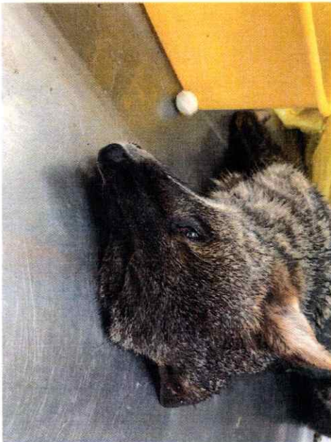
Zorro Chilote, Necropsia, proceso de descarne y trabajo de piel para curtiembre