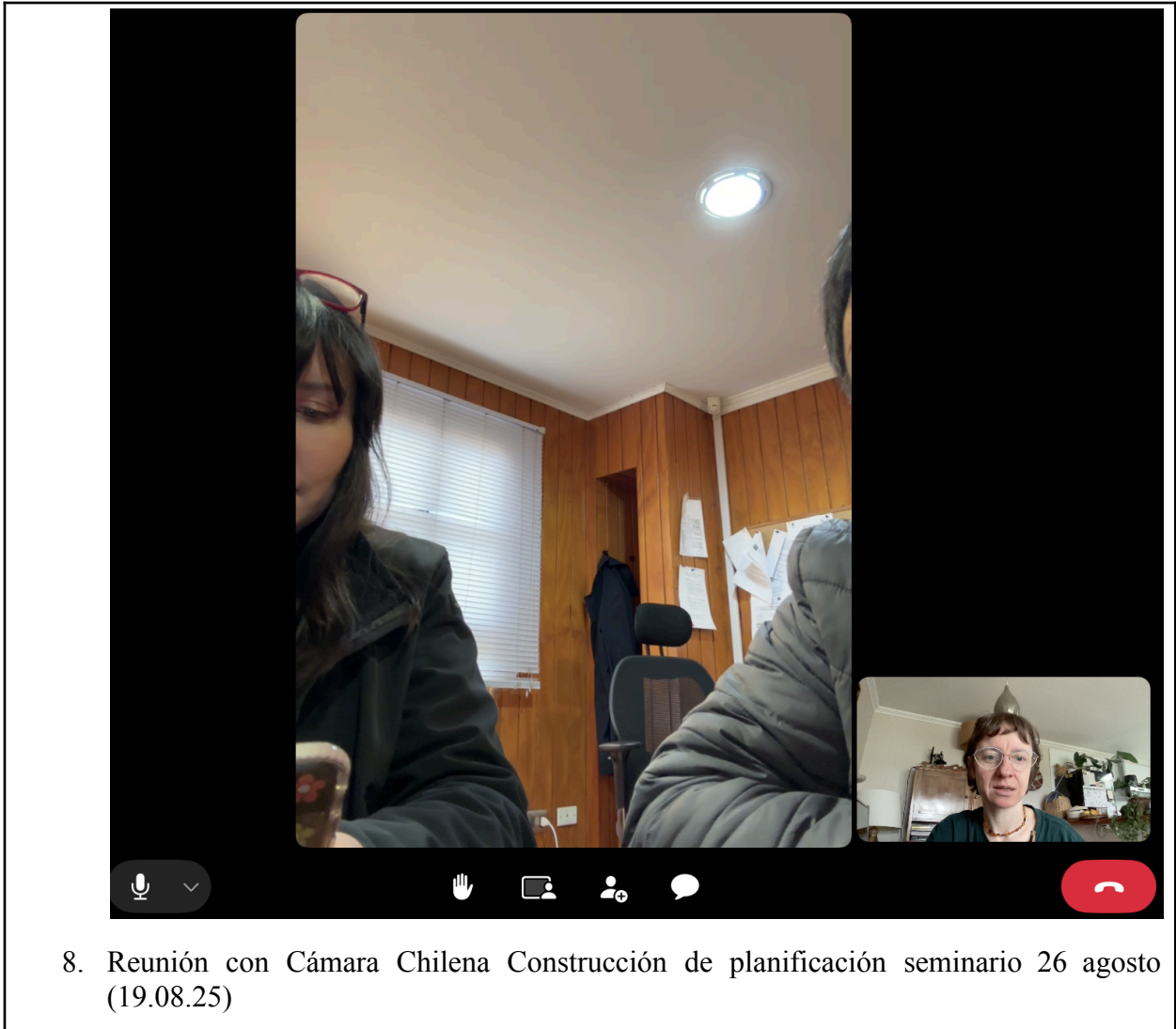
8. Reunión con Cámara Chilena Construcción de planificación seminario 26 agosto (19.08.25)