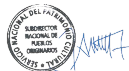
José Ancan Jara Subdirector Nacional de Pueblos Originarios