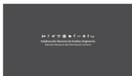
1. SUBPO A