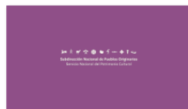
1. SUBPO B