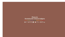
2. PLANES A