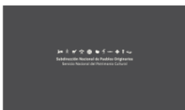
1. SUBPO A