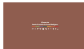
2. PLANES A