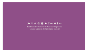
1. SUBPO B