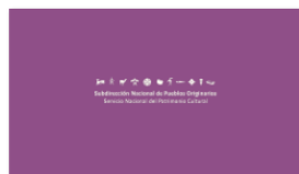
1. SUBPO B