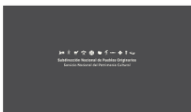
1. SUBPO A