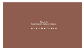
2. PLANES A