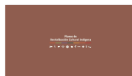
2. PLANES A