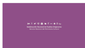
1. SUBPO B