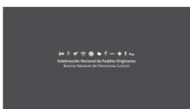
1. SUBPO A