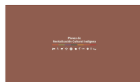
2. PLANES A