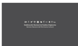
1. SUBPO A