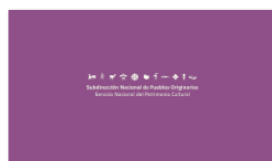
1. SUBPO B