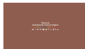
2. PLANES A