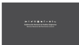
1. SUBPO A