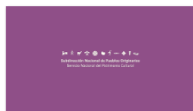
1. SUBPO B