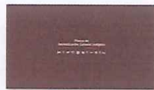
2. PLANES A