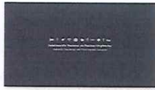
1. SUBPO A