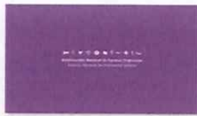
1. SUBPO B