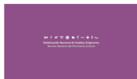
1. SUBPO B