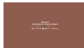
2. PLANES A