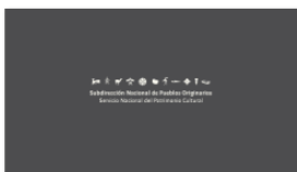
1. SUBPO A