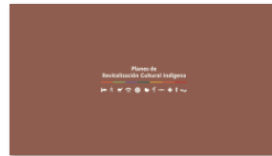
2. PLANES A