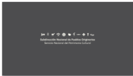
1. SUBPO A