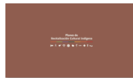
2. PLANES A