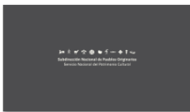
1. SUBPO A