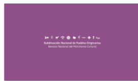
1. SUBPO B