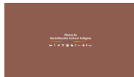
2. PLANES A