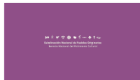
1. SUBPO B