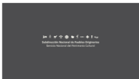
1. SUBPO A