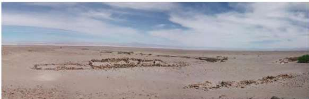
Fig. 1: Vista general del sitio según registro para nominación (ref. Expediente de nominación, p. 307)

Por último, es necesario señalar que, de no llevarse a cabo acciones de registro y conservación, Chile estaría incumpliendo un compromiso internacional. Asimismo, la no preservación de este bien impacta directamente sobre las posibilidades de ser una fuente para el desarrollo identitario, cultural y social de una de las comunidades vinculadas al Qhapaq Ñan, Sistema Vial Andino. Además, constituye parte del cumplimiento de las responsabilidades del Estado respecto de los pueblos indígenas, como da cuenta el artículo 4 del Convenio N°169 de la OIT que establece que " se adoptarán las medidas especiales que procedan para salvaguardar las personas, las instituciones, la propiedad, el trabajo, las culturas y el medio ambiente de los pueblos interesados " de conformidad con sus propios "deseos expresados libremente".