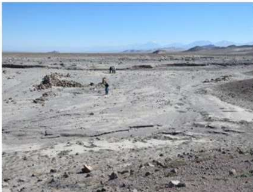
Fig. 2: Vista general del sitio durante visita del 06 de octubre de 2019 (Prado, C., octubre 2019)