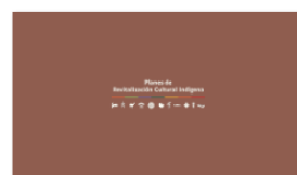
2. PLANES A