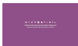
1. SUBPO B