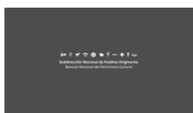
1. SUBPO A