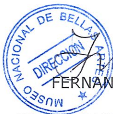
FERNANDO PEREZ OYARZUN DIRECTOR MUSEO NACIONAL DE BELLAS ARTES