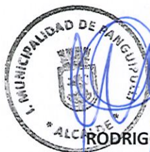
RODRIGO VALDIVIA ORIAS ALCALDE MUNICIPALIDAD DE PANGUIPULLI

Cultural para su uso en difusión sin fines de lucro, por lo que el ADJUDICATARIO es el responsable de contar con los permisos en caso de que las fotos incluyan a personas. Cualquier incumplimiento a esta cláusula será considerado un incumplimiento al convenio con el PMI en sí mismo, con las sanciones que sus bases ameriten.