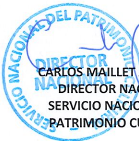
CARLOS MAILLET ARÁNGUIZ DIRECTOR NACIONAL SERVICIO NACIONAL DEL PATRIMONIO CULTURAL