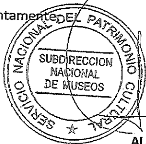
ALAN TRAMPE TORREJÓN SUBDIRECTOR NACIONAL DE MUSEOS